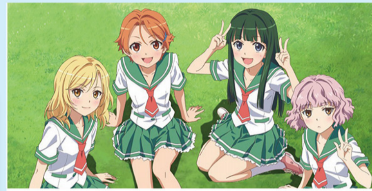
夏色観光協会下田運営本部